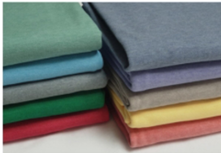
かトソー生地生産